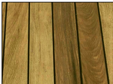
gereinigt und entgraut